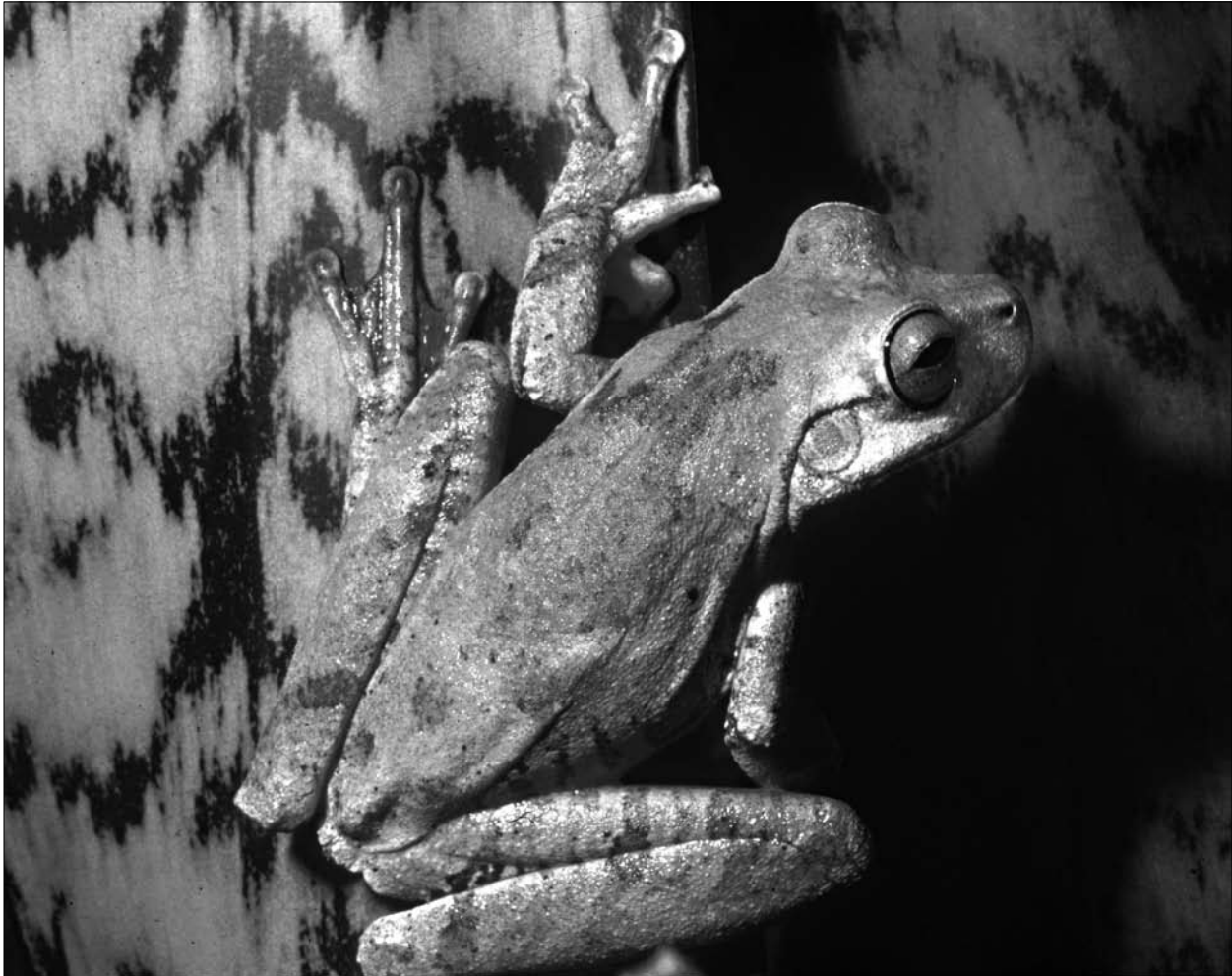
Figura 1. Exemplar de Hypsiboas crepitans oriundo da Serra São José, Feira de Santana, Bahia.

suas proporções. Eles foram analisados e medidos em estereomicroscópio com lente micrométrica.