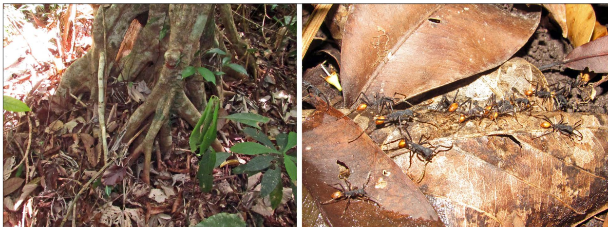
Figura 2. Bivaca de Eciton rapax encontrado abaixo da serrapilheira, junto à raiz de uma árvore. À esquerda, o registro das raízes de uma árvore onde foi encontrado o bivaque e à direita, a coluna de E. rapax retornando do forrageio, entrando embaixo da serrapilheira para acessar o bivaque.

A colônia permaneceu forrageando, levando ovos, larvas, pupas e adultos de suas presas para o bivaque durante todos os dias de observação (Figura 5) 1 . Enquanto a colônia esteve na árvore, a atividade de forrageio cessava no decorrer de chuvas intensas, que foram comuns no período em que o bivaque foi monitorado. No dia 15/01/2020, a colônia de E. rapax mudou o local do bivaque para uma área seca a 282 metros de distância.