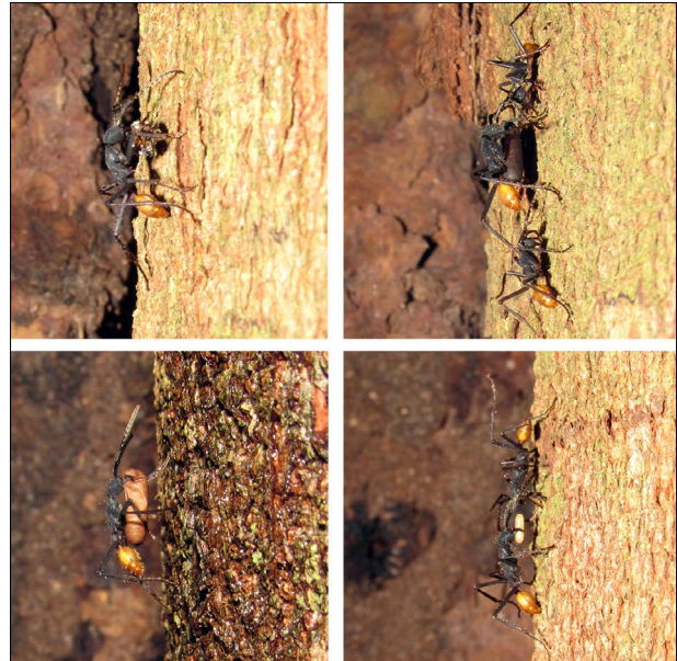
Figura 5. Operárias da espécie Eciton rapax retornando ao bivaque, transportando presas que a operária leva: A) parte de um adulto de formiga, B-C) um casulo; D) um ovo.

no estágio pupal e também quando é iniciada a postura de ovos (Hölldobler & Wilson, 1990). Nesse período importante do ciclo reprodutivo, a colônia de E. rapax manteve-se livre de perturbações provocadas pelas chuvas intensas.