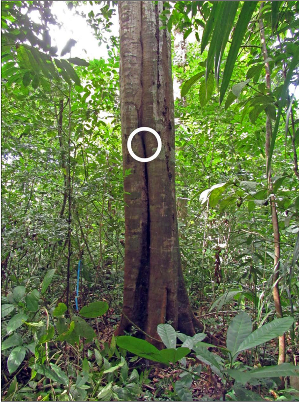
Figura 3. Árvore onde foi encontrado o bivaque. O círculo branco destaca o local exato da entrada, a aproximadamente 3 metros de altura do solo.

O novo local do bivaque situava-se no subsolo, na base de uma árvore. No dia 16/01/2020, a colônia mudou-se novamente para uma área alagada, não sendo possível encontrar o novo local de nidificação.