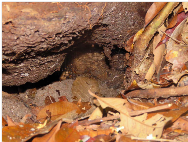
Figura 1. Bivaca de Eciton rapax encontrado em uma toca abandonada por um tatu. É possível ver as operárias na área interna da toca.

Durante a estação chuvosa, um dos bivaques foi encontrado em uma árvore e permaneceu no mesmo