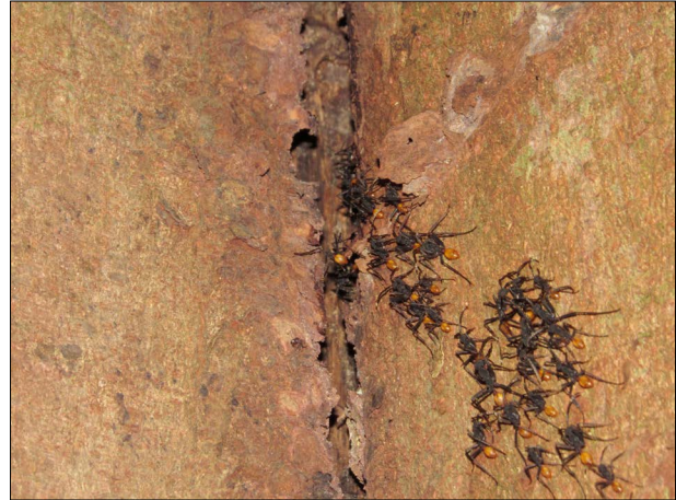
Figura 4. Operárias de E. rapax entrando na abertura da árvore que dava acesso à galeria onde se encontrava o bivaque.

O bivaque arbóreo foi registrado por seis dias consecutivos e se encontrava na fase estacionária, fase em que a colônia das espécies de Eciton tem a prole