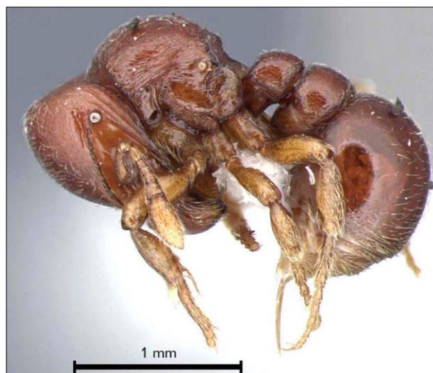
Figura 7. Espécime de Tatuidris recentemente depositado na coleção de formigas do MPEG.

Antes da contratação pelo MPEG, Rogério R. Silva liderou inúmeras expedições de coletas em todas as regiões do país, especialmente em áreas de Floresta Atlântica, Amazônia e Cerrado. Atualmente, parte deste material, antes depositado unicamente no MZSP, tem sido replicada na coleção do MPEG através da união de esforços dessas instituições. Como resultado, diversos táxons ainda não representados no acervo estão sendo depositados, incluindo o gênero de formigas Tatuidris Brown & Kempf, 1968 (Figura 7).