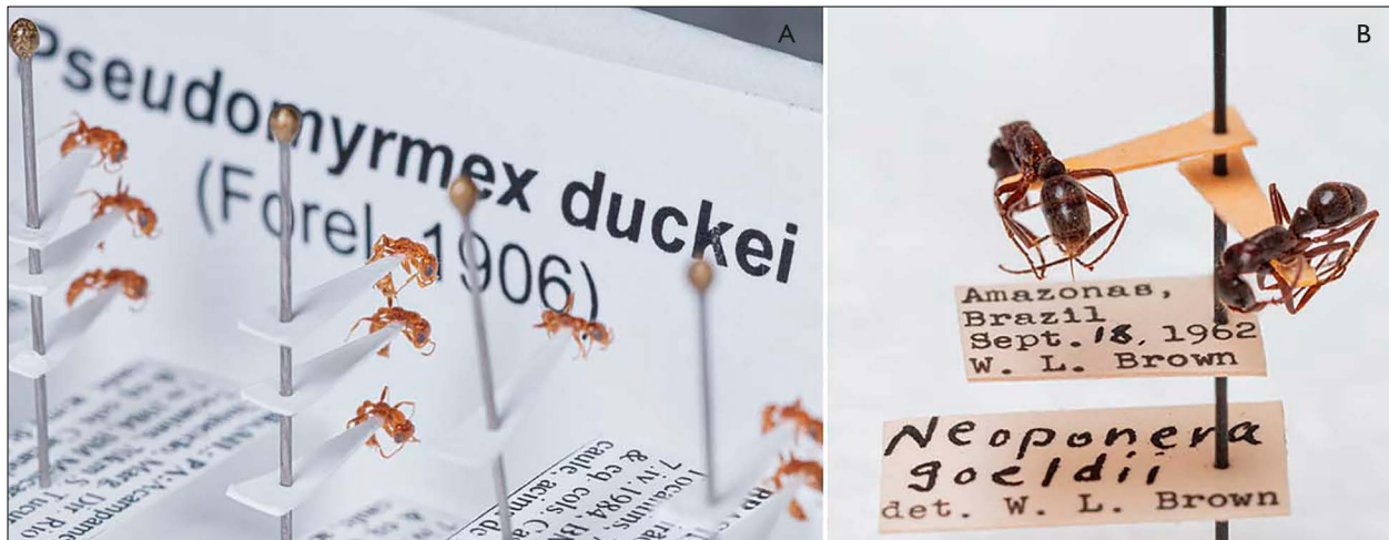
Figura 3. Espécimes de formigas pertencentes às espécies descritas em homenagem aos naturalistas do MPEG: A) homenagem a Adolpho Ducke; B) homenagem a Emílio Goeldi.

Foi também graças ao incentivo e ao material enviado por Emílio Goeldi que Forel publicou, em 1895, uma das primeiras listagens de espécies de formigas para o Brasil, intitulada "A fauna das formigas do Brasil", no mesmo periódico do presente artigo, que, na época, se chamava Boletim do Museu Paraense de História Natural e Ethnographia (Forel, 1895).