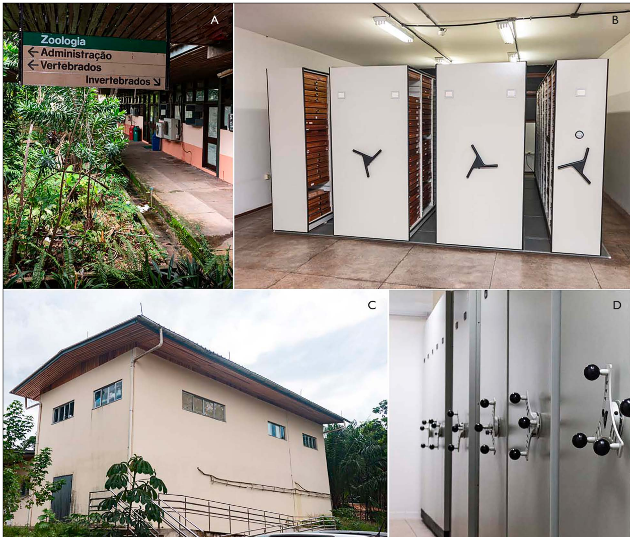
Figura 1. Estrutura destinada a abrigar a Coleção Entomológica do MPEG: A) prédio das coleções de insetos em via seca; B) um dos armários onde está depositada parte do acervo em via seca; C) prédio das coleções de invertebrados em via úmida; D) armário compactador onde ficam depositadas as amostras em via úmida.

O prédio do Departamento de Entomologia (Figura 1A) abriga as coleções de insetos em via seca