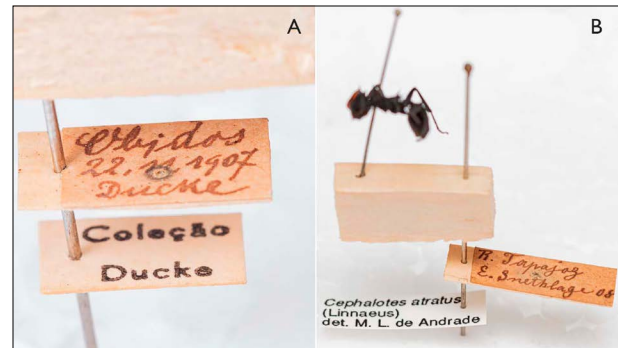
Figura 4. Material histórico depositado na coleção de formigas do MPEG coletado pelos naturalistas Adolpho Ducke (A) e Emília Snethlage (B). Fotos: César Augusto Chaves Favacho (2020).

O espécime mais antigo depositado na Coleção de Formigas do MPEG é uma Neoponera commutata (Roger, 1860), coletada por Edward A Klages próximo ao rio Caura (Venezuela), em 1899, no mesmo ano em que a coleção foi fundada. Aproximadamente neste período também foram incorporados espécimes de outras localidades, com destaque para o material que não foi enviado para instituições estrangeiras, coletado por Adolpho Ducke (Figura 4A) e Emília Snethlage (Figura 4B). As coletas de Adolpho Ducke foram realizadas entre os anos de 1902 a 1908, em diversas localidades do estado do Pará. O material de Emília Snethlage foi coletado em 1908, durante a lendária expedição científica na qual a naturalista fez uma travessia a pé,