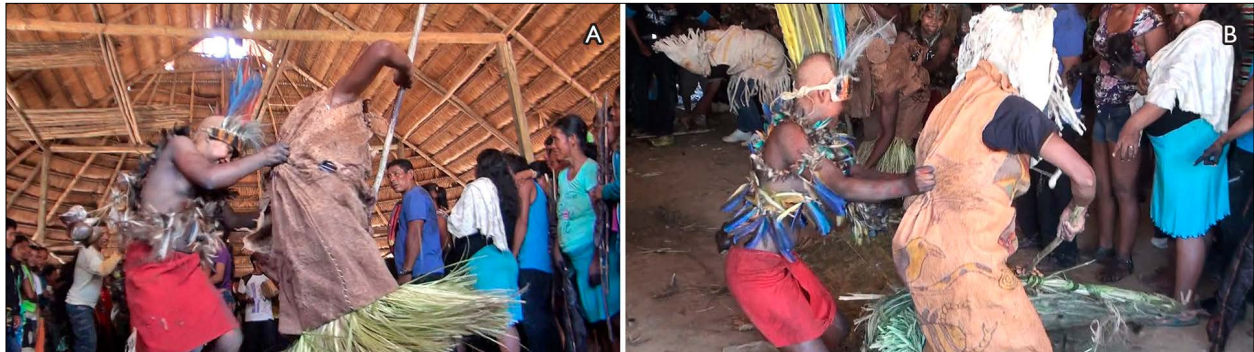
Figura 2. A e B) Moça dançando com mascarado na comunidade de Vendaval. Foto: Edson Matarezio (2013).

[Aprendem] com as outras, olhando primeiro as que já fizeram. Tem que olhar como que é, se já estão falando. A gente fala, “aguenta, tem que aguentar. Puxa ele para cá, puxa ele para cá”, assim vai. Ele quer virar para cutucar na menina o pênis dele. Mas tem que aguentar, para poder não acertar na gente, assim que é.