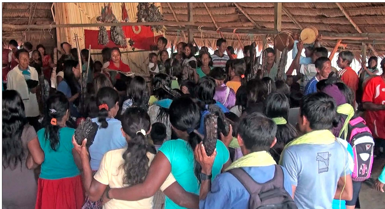
Figura 1. Ambiente da Festa com quarto de reclusão ( turi) ao fundo, na comunidade de Vendaval.