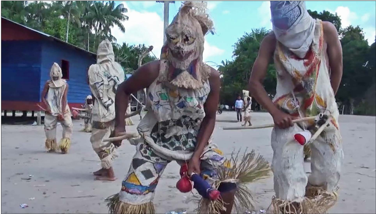
Figura 3. Mascarados To'ü na Festa de Moça Nova, na comunidade de Nova Esperança.