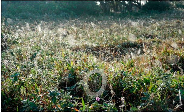
Figura 1. Aranhas e suas teias na restinga.