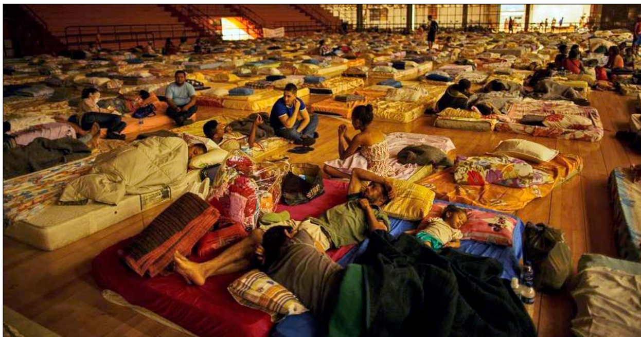
Figura 2. Desabrigados. Vítimas da tragédia em um ginásio da cidade de Mariana.

Nesta perspectiva, o presente artigo tem por objetivo debruçar-se – a partir da análise das falas dos