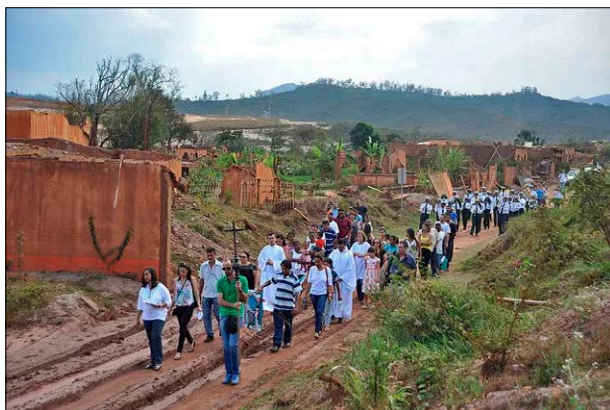
Figura 3. Procissão segue pelas ruínas de Bento Rodrigues para celebrar o dia de São Bento.