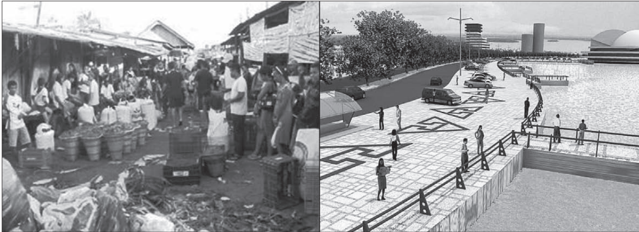
Figuras 3 e 4. Contraste entre o atual uso popular do Porto da Palha e o water front que se propõe. Desenho: Website da Prefeitura Municipal de Belém. Foto: Rodrigo Peixoto e Jakson Silva.

patrimonial que o projeto vai proporcionar àquele espaço não condiz com o atual uso popular. De fato, a requalificação alimenta o atual boom imobiliário que vai configurando o perfil da cidade com torres de alto padrão construtivo: